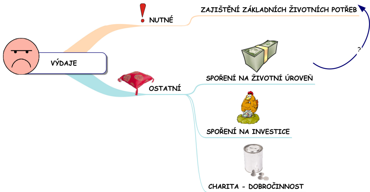
Obrázek 2: Výdaje