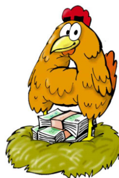
Obrázek 6: Penězonosič

Abychom penězonosiče získali, musíme obětovat buď svůj čas – například na vybudování vlastního podniku, na zpracování podnikatelského záměru nebo investovat své peníze (do stavebního spoření, podílových fondů, kapitálového pojištění, akcií, dluhopisů atd.). Pouze vlastnictví penězonosičů umožňuje dosáhnout vlastních finančních zdrojů příjmů.