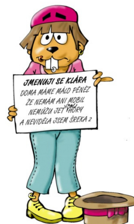
Obrázek 2: Klárka