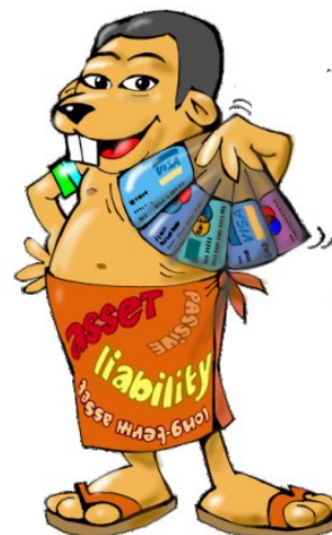
Obrázek 8: Robert Kiyosaki

Zdá se, že se v současné společnosti bez peněz neobejdeme.