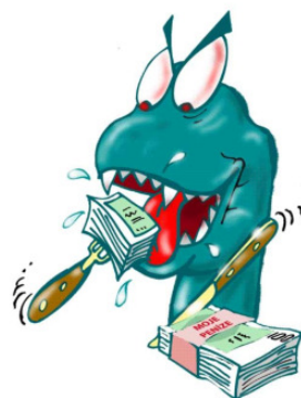
Obrázek 5: Penězožrout

Penězožroutů se samozřejmě nemůžeme zbavit, ke svému životu je potřebujeme. Ale na druhou stranu bychom si je neměli pořizovat zbytečně a neuváženě.